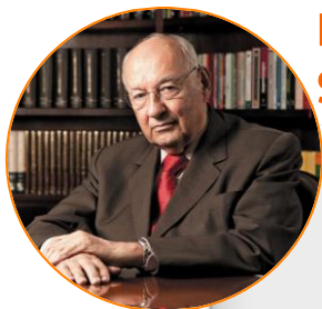
Dr. Ives Gandra da Silva Martins

“Todos deveriam conhecer o produto. O profissional que o conhece, não irá dispensá-lo do seu dia a dia.”