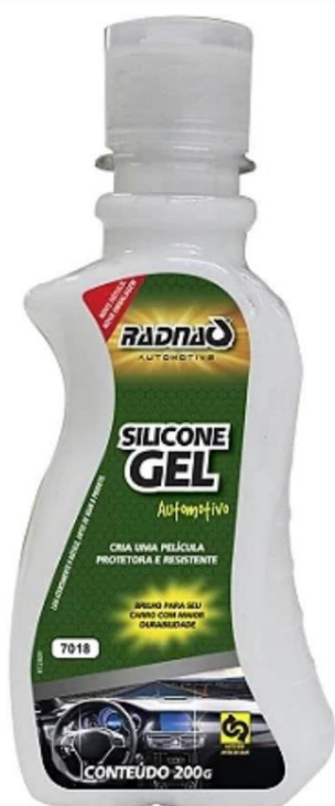
Silicone Gel Quantidade: 200g Marca: Radnaq