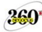
Época 360° 2017 Melhor administrada no setor de Telecomunicações