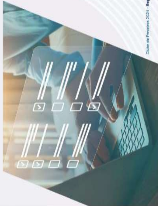
Clube de Parceiros 2024 - Regulamento 15

7.3. As empresas que não se adequarem às regras aqui descritas e às normas do Manual do Uso dos Benefícios poderão sofrer descontos em suas pontuações. Casos previstos: cancelamento do uso do espaço em menos de 72h, aplica-se o desconto integral; cancelamento do uso do espaço em até três dias antes da data, aplica-se desconto de 50% dos pontos; o não cumprimento do horário estabelecido para uso de espaços poderá ocasionar o cancelamento das reservas seguintes, bem como o não atendimento de futuras solicitações, por parte do solicitante, além de desconto de 500 pontos; alteração de layout não prevista na solicitação de reserva, desconto de 50% dos pontos do espaço. Casos não previstos poderão ser indicados pela Diretoria da FGV EAESP.