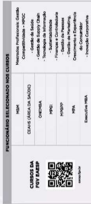
TABELA 3A | DESCONTO EM CURSOS - 10% DE DESCONTO